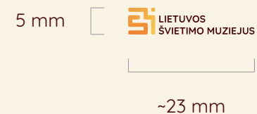
Minimalus logotipo dydis